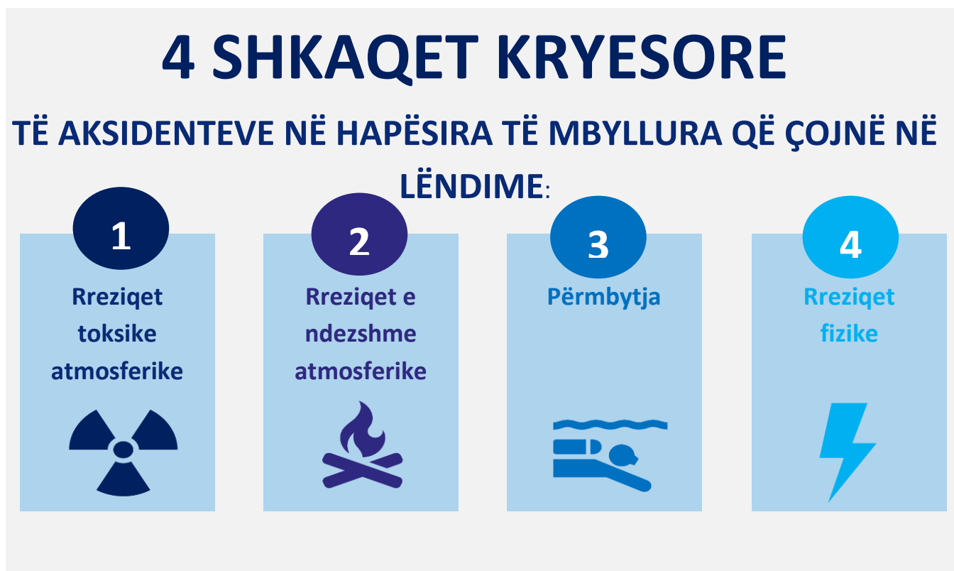
Figura 2 – 4 shkaqet kryesore të aksidenteve në hapësira të mbyllura që çojnë në lëndime

Cilat janë rreziqet më të zakonshme në hyrje të hapësirës së mbyllur?