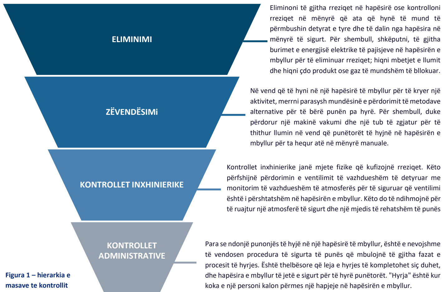
Figura 1 – hierarkia e masave të kontrollit

Është e rëndësishme të ndiqni hapat në hierarkinë e masave të kontrollit për të menaxhuar rreziqet e identifikuara: